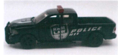
Produktfoto / Product photo / Photo du produit

Sieper GmbH Schlittenbacher Str. 60 58511 Lüdenscheid