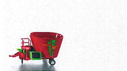
Produktfoto / Product photo / Photo du produit

Sieper GmbH Schlittenbacher Str. 60 58511 Lüdenscheid