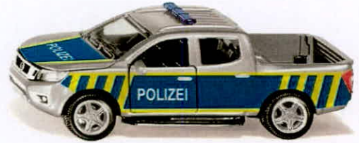
Produktfoto / Product photo / Photo du produit

Sieper GmbH Schlittenbacher Str. 60 58511 Lüdenscheid