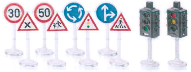
Produktfoto / Product photo / Photo du produit

Sieper GmbH Schlittenbacher Str. 60 58511 Lüdenscheid