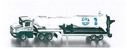
Produktfoto / Product photo / Photo du produit

Sieper GmbH Schlittenbacher Str. 60 58511 Lüdenscheid