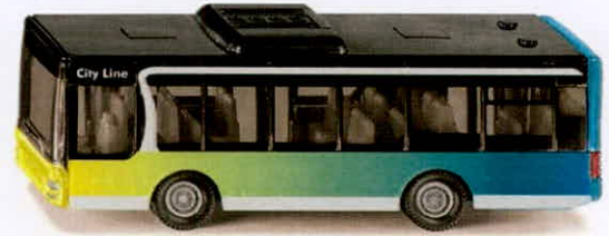
Produktfoto / Product photo / Photo du produit

Sieper GmbH Schlittenbacher Str. 60 58511 Lüdenscheid