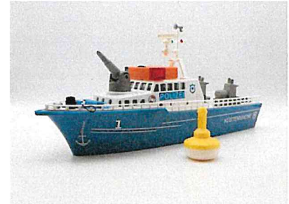
Produktfoto / Product photo / Photo du produit

Sieper GmbH Schlittenbacher Str. 60 58511 Lüdenschaid