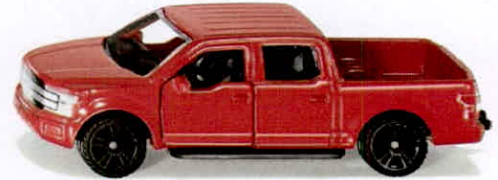
Produktfoto / Product photo / Photo du produit

Sieper GmbH Schlittenbacher Str. 60 58511 Lüdenscheid