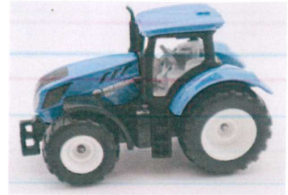
Produktfoto / Product photo / Photo du produit

Sieper GmbH Schlittenbacher Str. 60 58511 Lüdenscheid