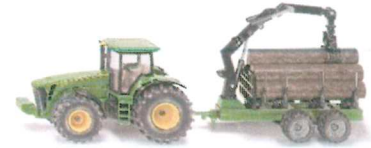
Produktfoto / Product photo / Photo du produit

Sieper GmbH Schlittenbacher Str. 60 58511 Lüdenscheid