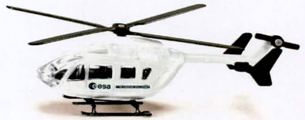
Produktfoto / Product photo / Photo du produit

Sieper GmbH Schlittenbacher Str. 60 58511 Lüdenscheid